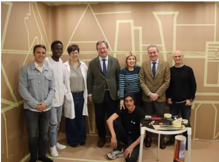
Bingen Zubiria y Andoni Iturbe, Consejero y Viceconsejero de Cultura del Gobierno Vasco