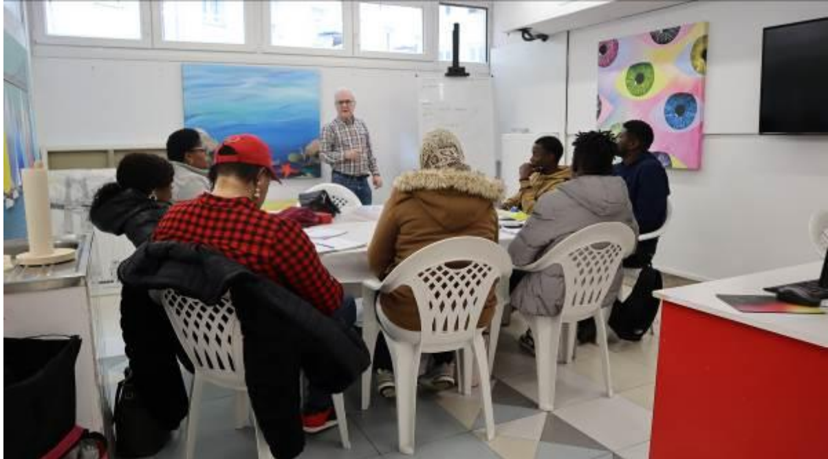
Clases de formación en castellano en el aula del piso superior del centro AmiArte

Actividad destinada a personas con una problemática importante como es la barrera lingüística, dotándoles de herramientas comunicativas a tres niveles diferentes. También tramitamos convalidaciones de estudios y preparamos a los jóvenes para la consecución del título de la ESO. Así mismo ayudamos a las personas para que no se vean afectadas por la brecha digital, ofreciendo una formación en el uso de las nuevas tecnologías, a falta de recursos digitales por parte de los usuarios, para poder trabajar online con las instituciones o su entorno.