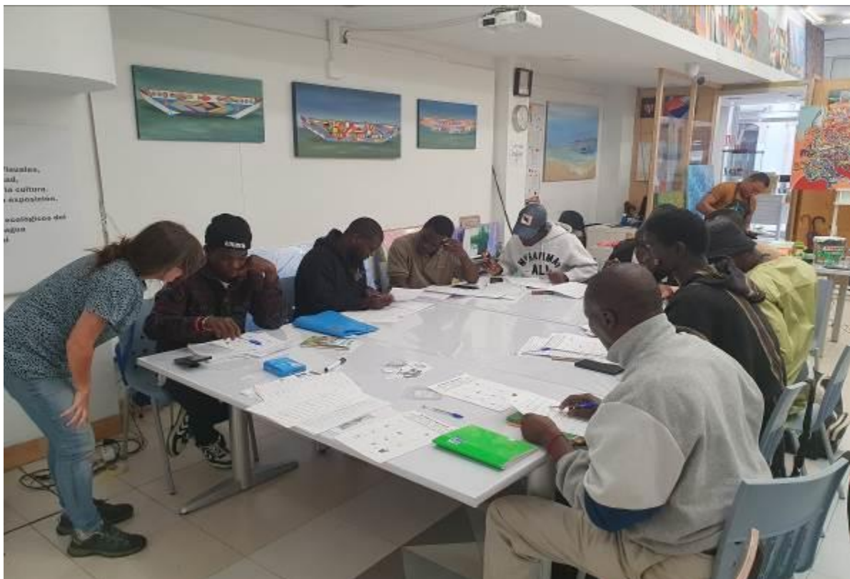
Aula polivalente en la planta baja del centro.